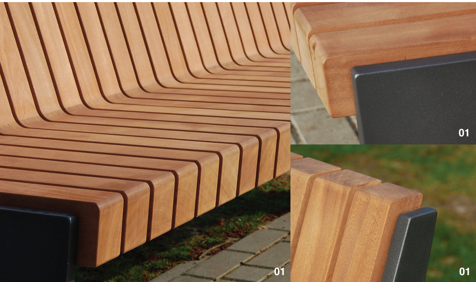
LEHNENBANK „IRIS“ 01 Art. Nr. 15 0200 IDEE UND ENTWURF SCAPE LANDSCHAFTSARCHITEKTEN, DÜSSELDORF

Die Lehnbank „IRIS“ ist eine Bank, die durch Design und qualitativ hochwertige Verarbeitung überzeugt.