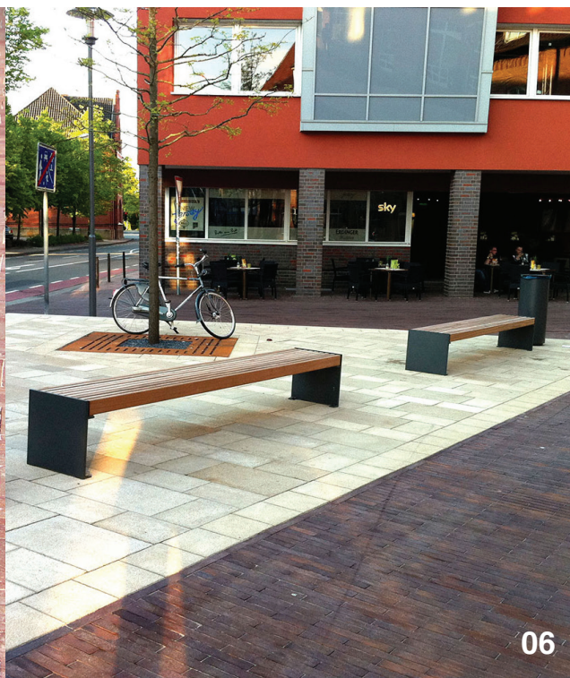
HOCKERBANK „IMMO“ 06 Art. Nr. 15 0014 Länge 3,00 m

Die Modellreihe „IMMO“ wird als Systembankserie hergestellt. Die Seitenwangen bestehen aus Aluminiumguss t = 20 mm. Die Längen sind variabel. „IMMO“ ist als Lehnbank oder Hockerbank erhältlich. Mit dem LiF-Stabilisierungsrohr werden die Bankleisten zusätzlich fixiert und bleiben in Form.